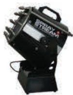
TYPE: SS 10 V - Bat