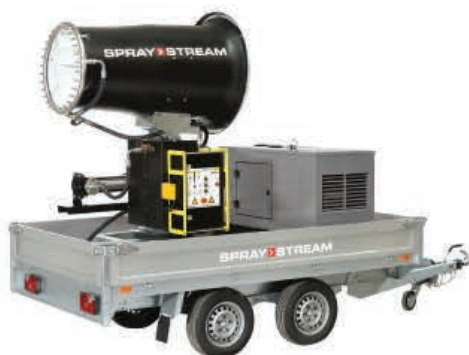
TYPE: SS 50i - 70i Power