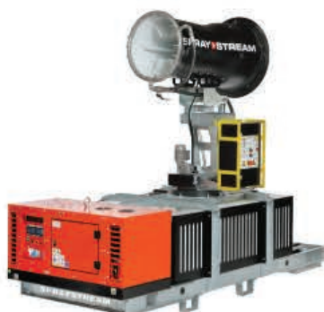
TYPE: SS 35i Autonome