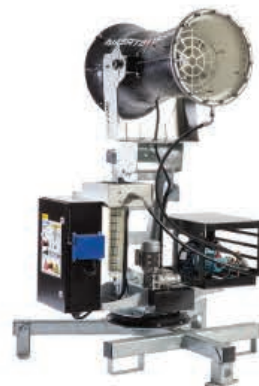
TYPE: SS 25i Cart single