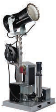
TYPE: SS 25i Plateforme