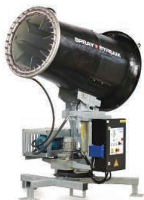
TYPE: SS 50i HP - 80i HP