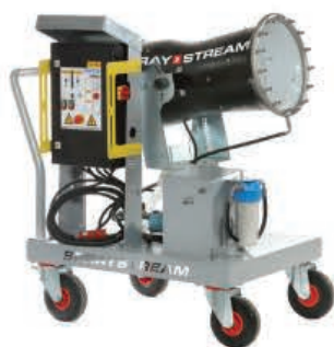
TYPE: SS 25i Trolley