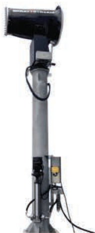
TYPE: SS 35i - 100i Tower