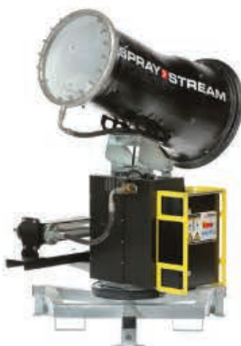
TYPE: SS 35i