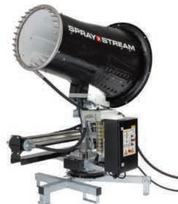
TYPE: SS 100i