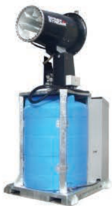
TYPE: SS 50i VT