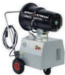
TYPE: SS 15i Trolley