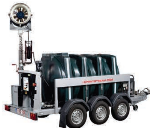
TYPE: SS 25i Autonome