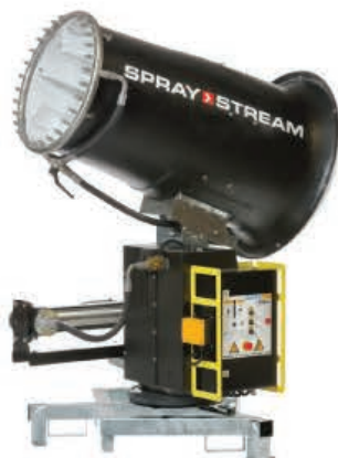
TYPE: SS 50i - 80i