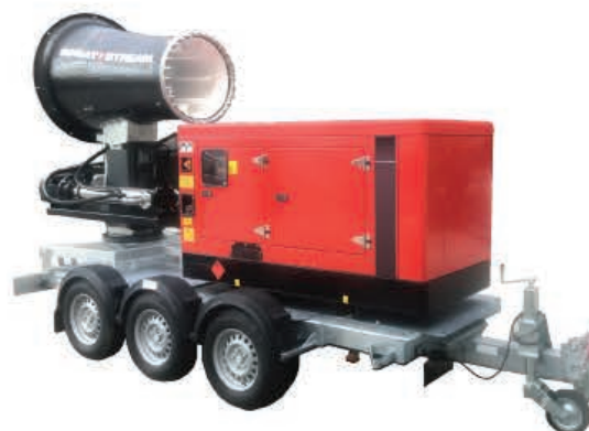
TYPE: SS 80i - 100i Power